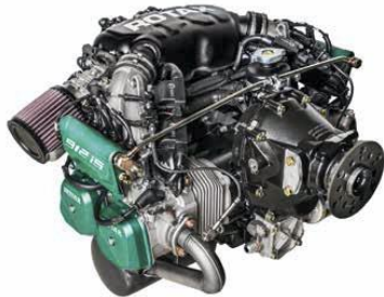
ROTAX 912iS SPORT Injection électronique

Le CT SUPER SPORT dispose des dernières évolutions en termes de sécurité afin de protéger ses pilotes et passagers. Ainsi, tous les CT sont équipés du système de sauvetage par parachute qui améliore la sécurité. La cellule de survie en Carbone Kevlar protège les occupants. Le bâti moteur et ses points d'attaches sur le fuselage réduisent les possibilités d'intrusion du moteur dans la cabine. Les hamais de sécurité 4 points et les parties composites de la structure absorbent l'énergie de l'impact et réduisent les charges supportées par les occupants. La plage de vitesse étendue et les marges de résistance de la structure du CT SUPER SPORT rassurent les pilotes dans les conditions difficiles. Testé et certifié à 600kg, le CT SUPER SPORT peut